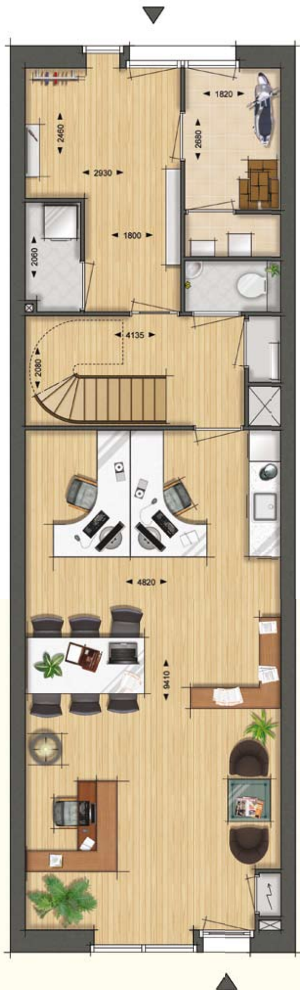
Interieur suggestie Woningtype B6 Woon-Werkwoning Begane Grond