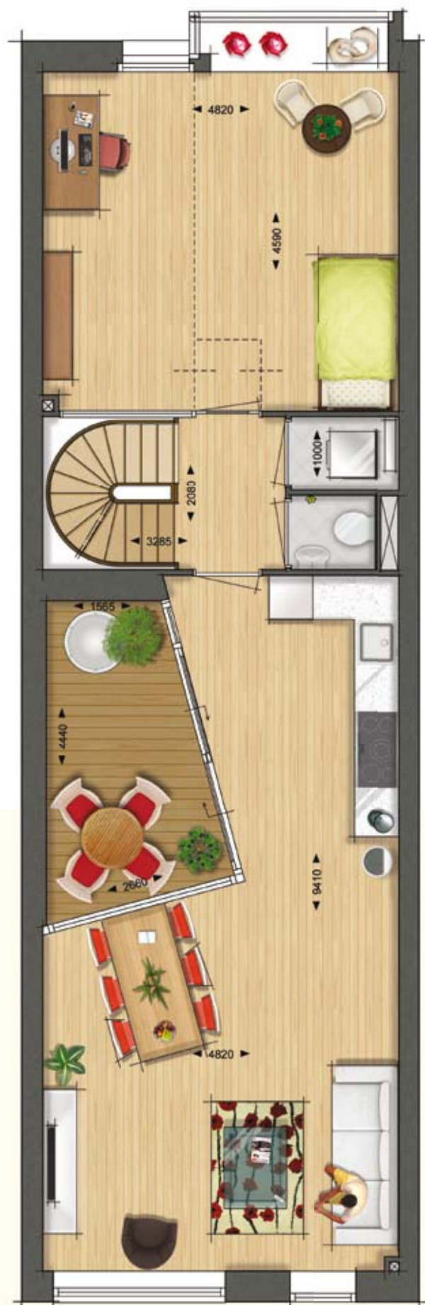
Interieur suggestie Woningtype B6 Woon-Werkwoning Eerste verdieping