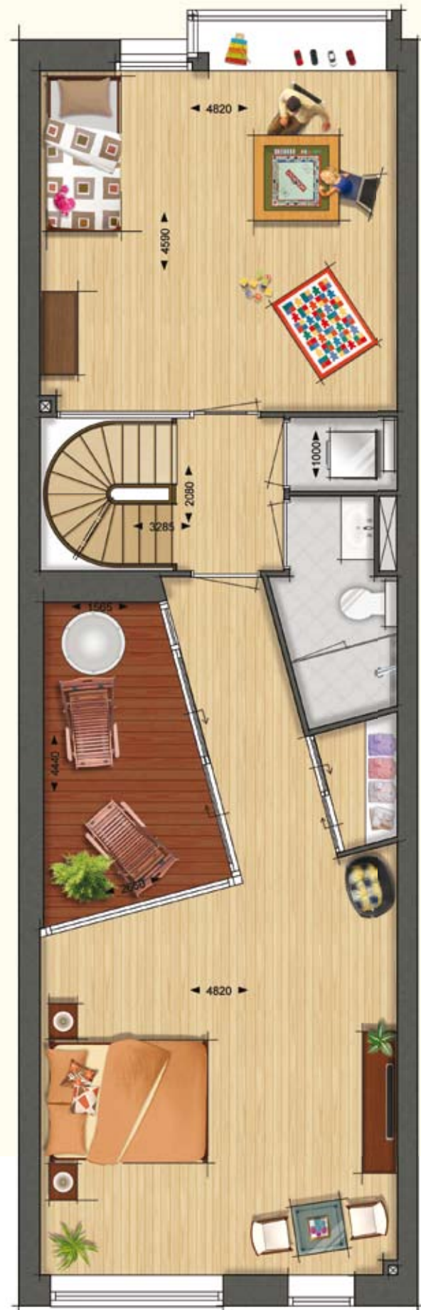
Interieur suggestie Woningtype B6 Familiewoning Eerste verdieping