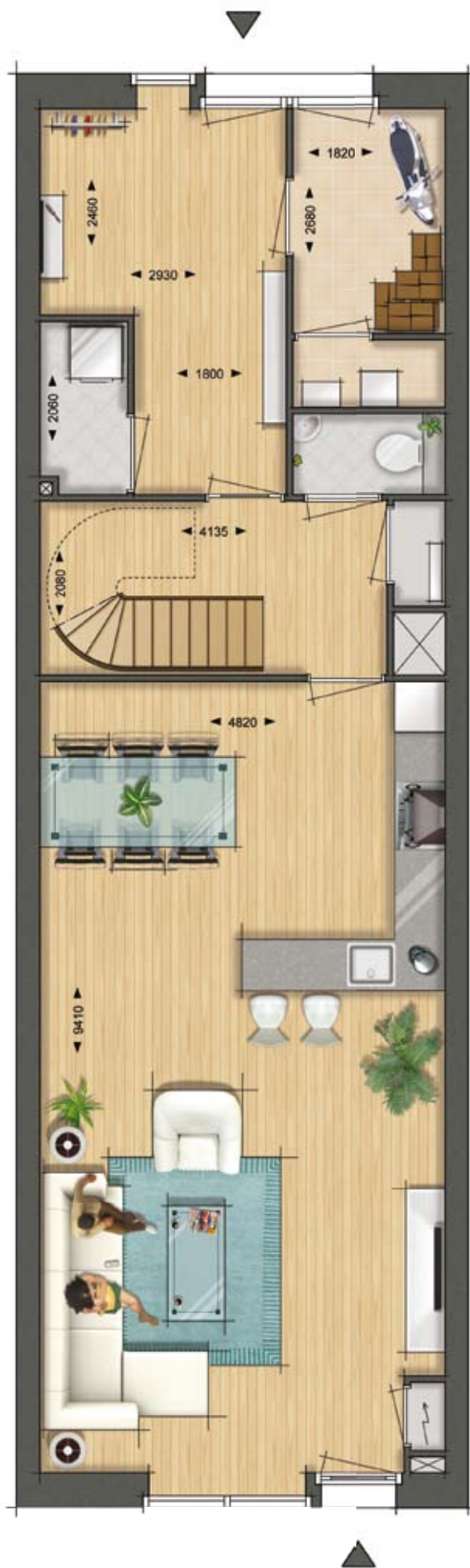
Interieur suggestie Woningtype B6 Familiewoning Begane Grond